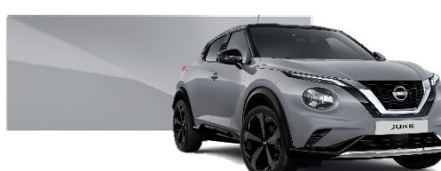
Szary ceramiczny - KBY