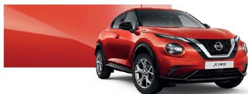
Czerwony Fuji Sunset - NBV