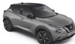
Szary ceramiczny + Czarny dach - XFU Personalizacja wnętrza N-Design: B

Dostępne 3 opcje personalizacji wnętrza dla wersji N-Design: