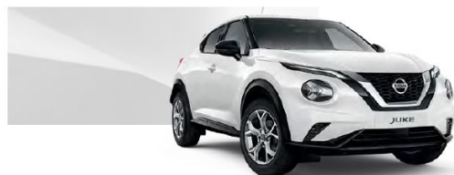
Biały - 326

Lakier metalizowany / premium – 2.400 zł