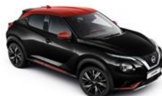
Czarny + Czerwony Fuji Sunset dach - XFC Personalizacja wnętrza N-Design: B, R