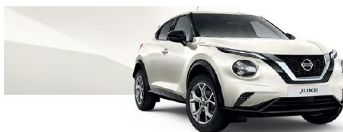
Biały perłowy - QAB