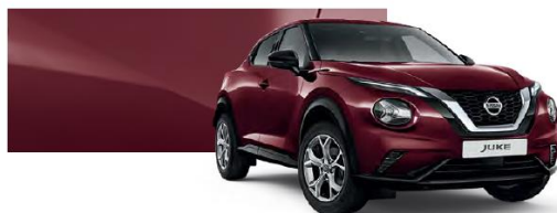
Burgundowy - NBQ