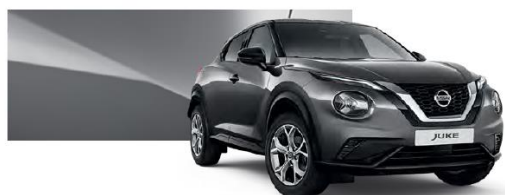
Szary - KAD

Lakier metalizowany / premium – 2.400 zł