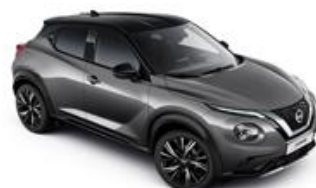
Szary + Czarny dach - XDJ Personalizacja wnętrza N-Design: W, B, R