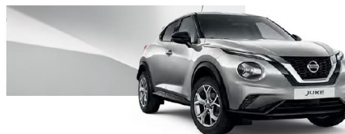
Srebrny - KYO