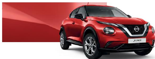
Czerwony - Z10