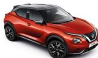
Czerwony Fuji Sunset + Srebrny dach - XEZ