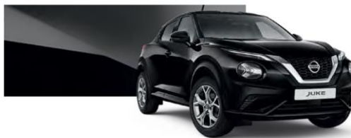
Czarny - Z11