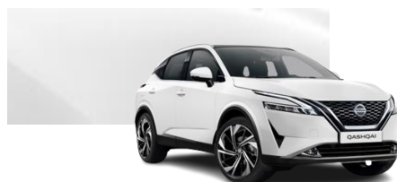
Biały - 326