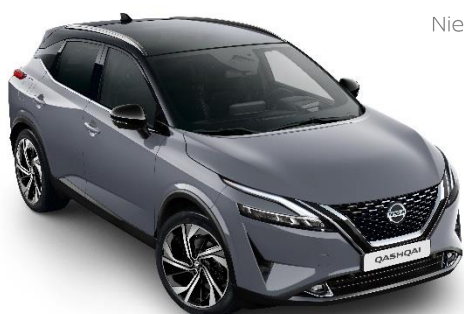
Szary ceramiczny + Czarny dach - XFU