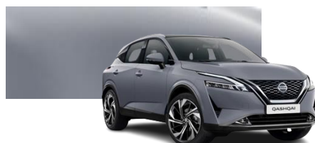
Szary ceramiczny - KBY