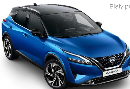
Niebieski + Czarny dach - XFV