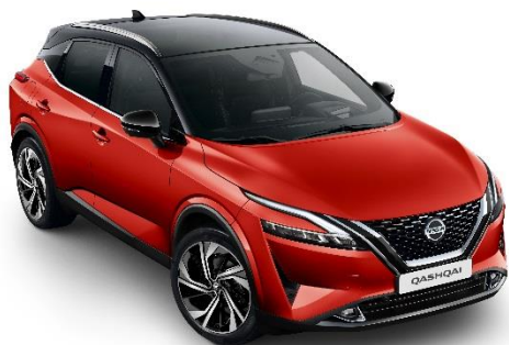
Czerwony Fuji Sunset + Czarny dach - XEY