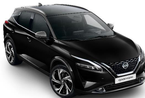
Czarny + Szary dach - XDK