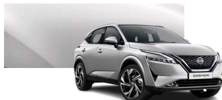
Srebrny - KY0