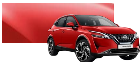
Czerwony - Z10