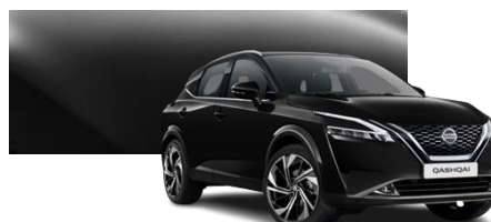
Czarny - Z11