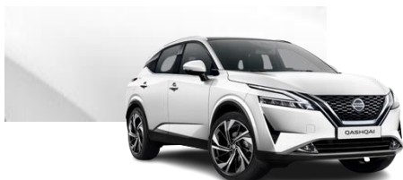
Biały perłowy - QAB