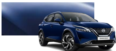
Granatowy - RBN