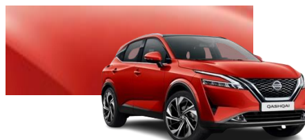
Czerwony Fuji Sunset - NBV