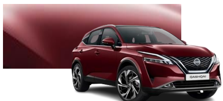
Burgundowy - NBQ