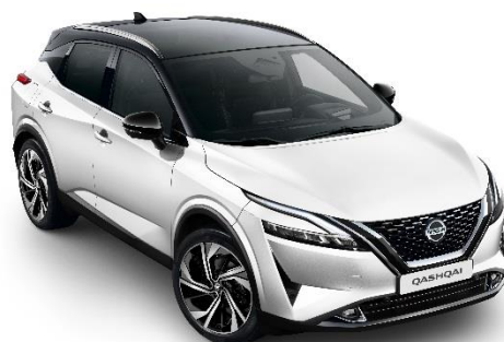
Biały perłowy + Czarny dach - XDF