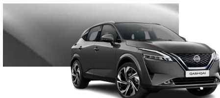
Szary - KAD