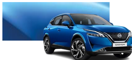
Niebieski - RCF