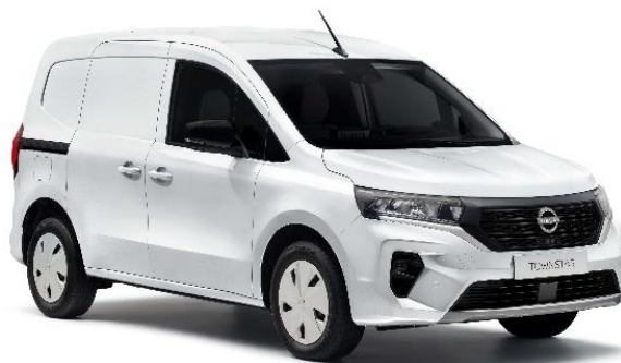
Biały – QNG

Lakier niemetalizowany – dopłata: 976 zł