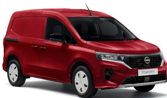
Czerwony Carmin – NPF