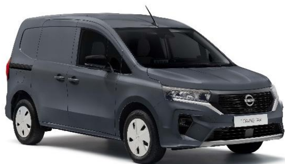
Ciemnoszary – KPW

Lakier niemetalizowany – dopłata: 976 zł