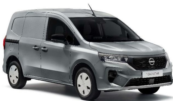
Szary Highland – KQA