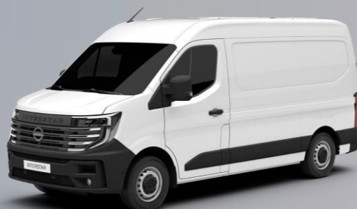
biały - QNG