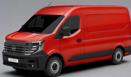
czerwony - 071