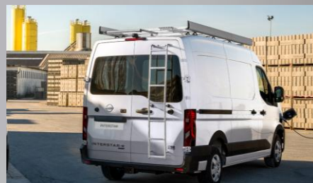
Stalowa drabina Na tylne drzwi