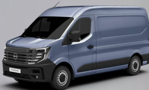
jasnoniebieski - J47