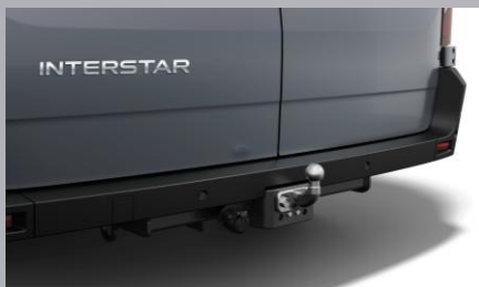
Hak holowniczy (pakiet)