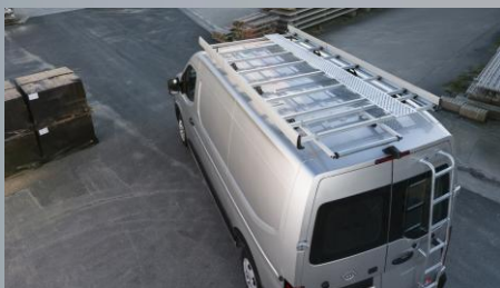
Bagażnik dachowy (aluminium)