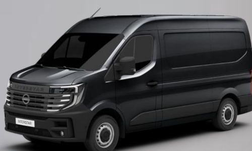
czarny - 676