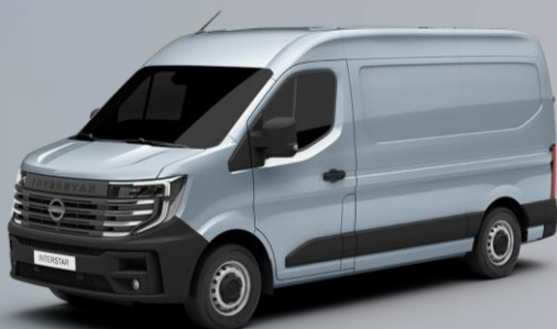
srebrny - KNH