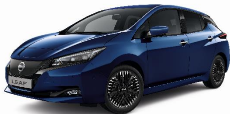
Niebieski Uniwersalny - RCJ