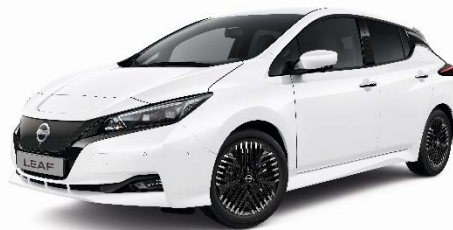
Biały – 326