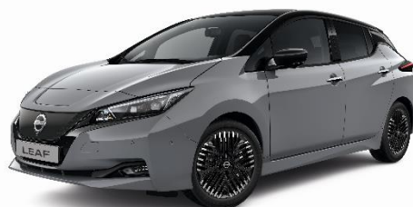
Szary Ceramiczny + czarny dach - XFU