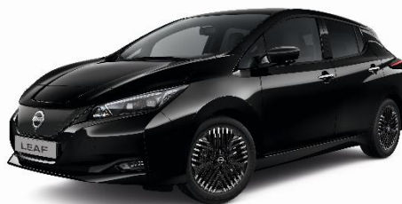
Czarny – Z11