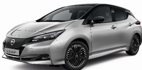
Srebrny + czarny dach - XDR