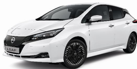
Biały perłowy - QAB

*- Dostępność wersji kolorystycznych ograniczona. Szczegóły u autoryzowanych dealerów.