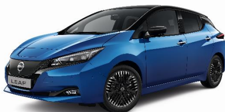
Niebieski Metaliczny + czarny dach - XFV

*- Dostępność wersji kolorystycznych ograniczona. Szczegóły u autoryzowanych dealerów.