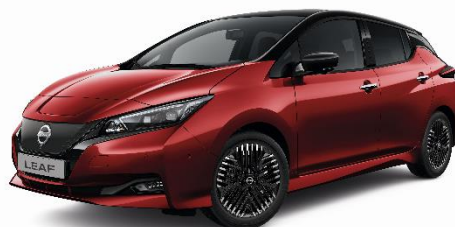
Czerwony + czarny dach - XDS