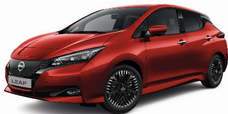
Czerwony – Z10