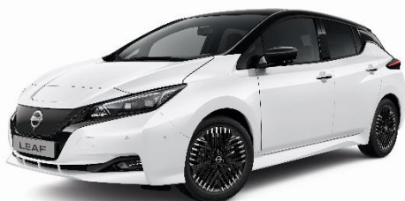
Biały perłowy + czarny dach - XDF