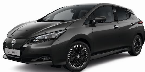
Szary – KAD