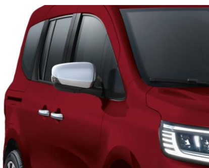
Nakładka na klamkę