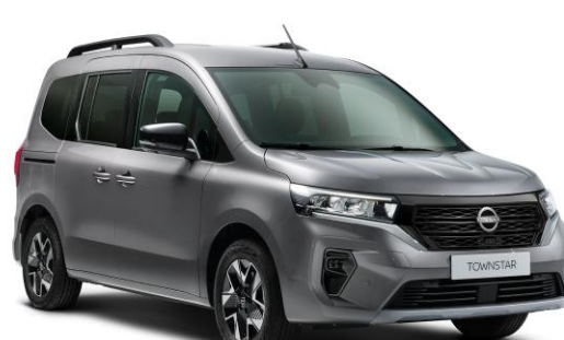
Szary Cassiopae - KNG