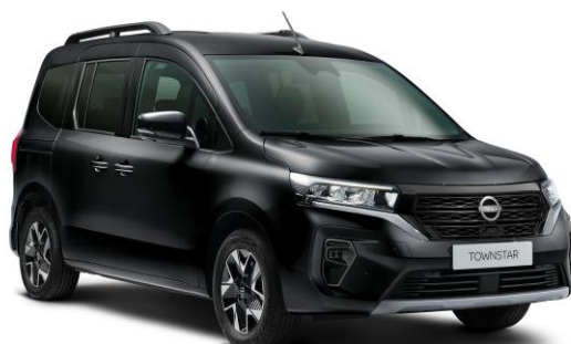
Czarny - GNE

Lakiery metalizowane / perłowe - 2 400 zł