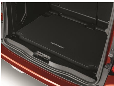
Mata bagażnika welurowa