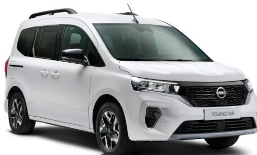
Biały - QNG

Lakiery metalizowane / perłowe - 2 400 zł