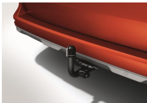
Hak holowniczy - zdejmowany