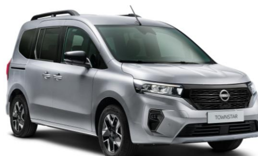
Szary Highland - KQA