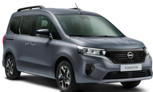
Ciemnoszary - KPW