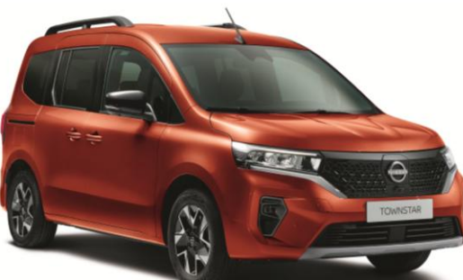
Pomarańczowy - CNZ